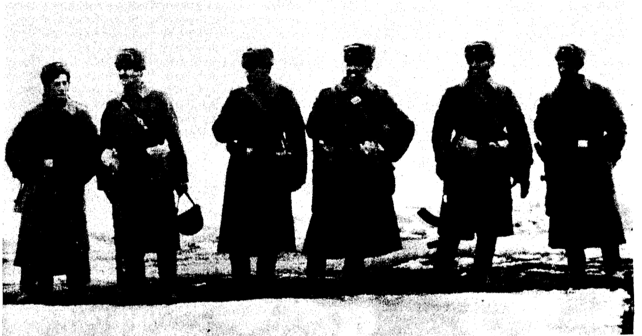
Soldats soviétiques sur la frontière entre l'Afghanistan et le Pakistan

Le président Carter et son docteur Folamour, le conseiller à la sécurité nationale, Zbigniew Brzezinski, se sont saisis du prétexte de la présence des troupes soviétiques en Afghanistan pour traduire en actes la rhétorique de guerre froide de leur "croisade pour les Droits de l'homme" antisoviétique. Le 4 janvier, Carter est apparu à la télévision pour annoncer à tout le pays que les USA allaient s'engager