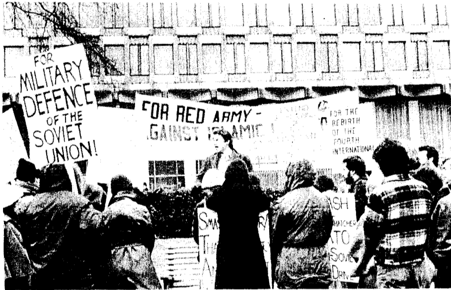
Manifestation de la SL/B devant l'ambassade US à Londres : "Pour l'Armée rouge - Contre la réaction islamique"

Commandées par une bureaucratie parasitaire qui a usurpé le pouvoir politique des ouvriers soviétiques, bien des vies de soldats de l'Armée rouge ont souvent été sacrifiées dans des buts contre-révolutionnaires : de la guerre de frontière sino-soviétique au soutien au Derg bonapartiste sanguinaire qui se livre au génocide en Ethiopie. Mais l'Armée rouge en Afghanistan, le soutien des Russes à l'héroïque peuple vietnamien, et le soutien soviétique à l'aide des Cubains en Ango-