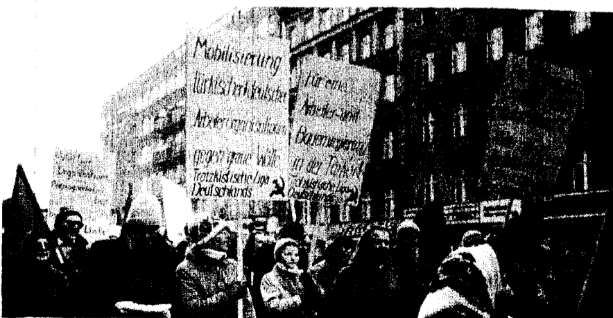
Cortège de la TLD à Berlin: "Mobilisation des organisations ouvrières turques et allemandes contre les Loups Gris"