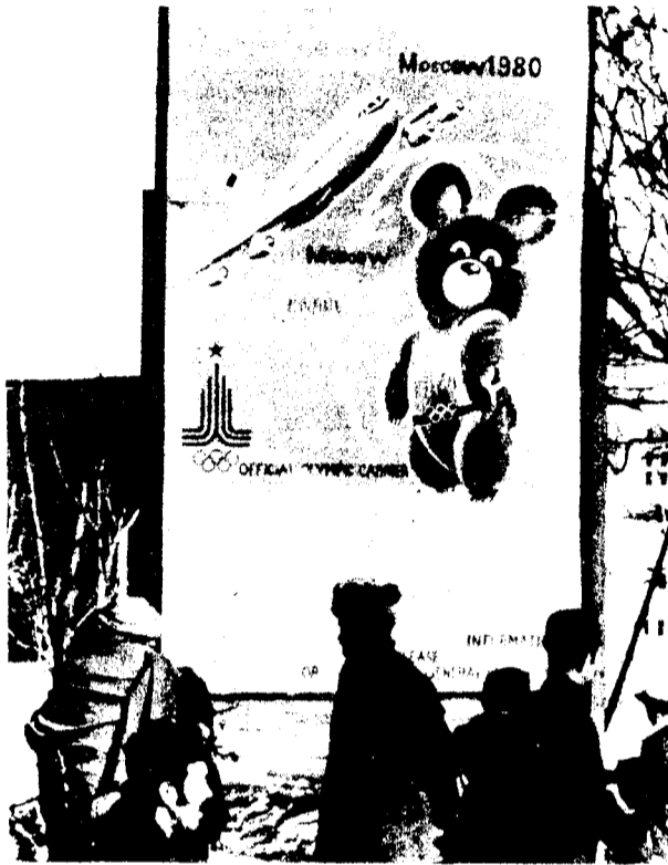
Affiche des Jeux olympiques de Moscou à Kaboul. Les trotskystes disent: A bas le boycott de Carter!

La réaction de l'IMG et de la LCR devant l'Armée rouge en Afghanistan rappelle celle de l'opposition petite-bourgeoise de Burnham-Shachtman dans le SWP américain trotskyste à la veille de la deuxième guerre mondiale lorsqu'ils dénoncèrent l'invasion, par les soviétiques, de la Finlande du baron von Mannerheim après le pacte Hitler-Staline. Ces "trotskyistes" qui versent aujourd'hui des larmes de crocodile sur le "pauvre petit Afghanistan indépendant"