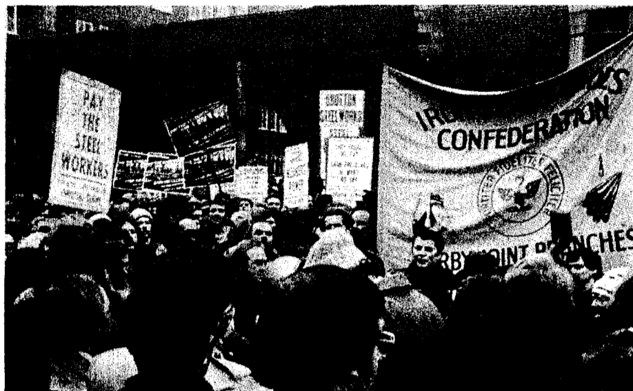
Birmingham, 11 janvier: les sidérurgistes manifestent contre le gouvernement

Pendant des années les dirigeants des syndicats de l'acier ont accepté des "sacrifices" afin de "sauver la sidérurgie britannique", négociant des salaires en-dessous de la moyenne allant de pair avec des dizaines de milliers de licenciements. Mais finalement la BSC, l'enragée Margaret Thatcher et le secrétaire à l'industrie Keith Joseph sont allés trop loin. La grève de la sidérurgie est survenue brutalement à la suite d'une série d'attaques majeures contre les travailleurs britanniques et les pauvres, attaques qui allaient de la réduction massive des services sociaux